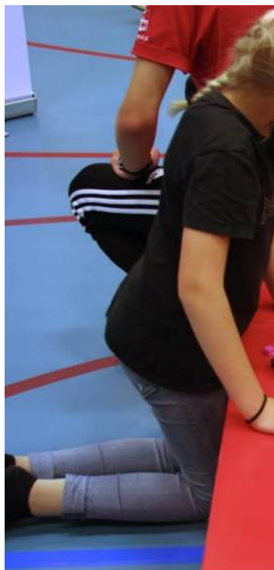
Legohav. Det fanns bitar så det räckte till alla.