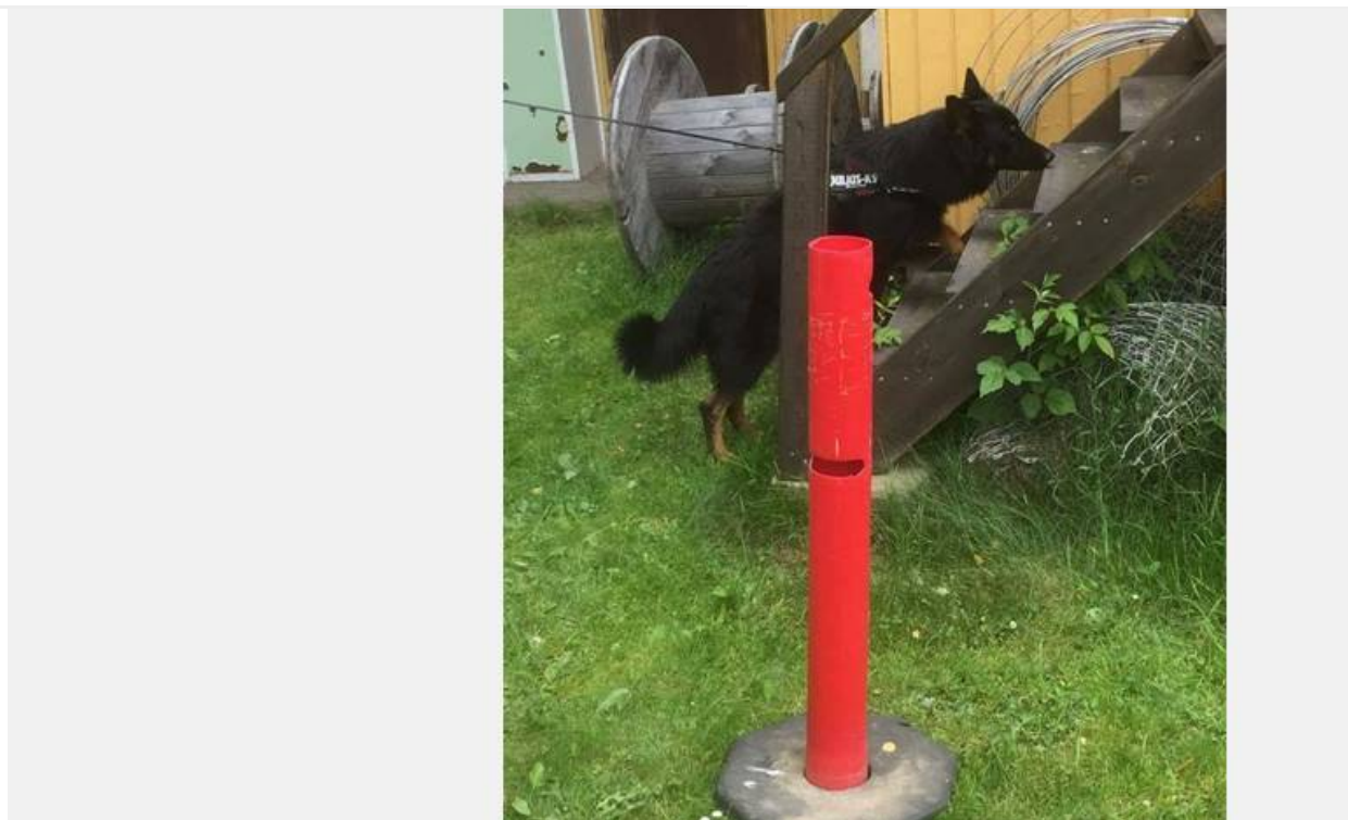
Sökningar. Hundarnas uppgift vid denna tävlingsgren var att hitta gömda doftkällor.